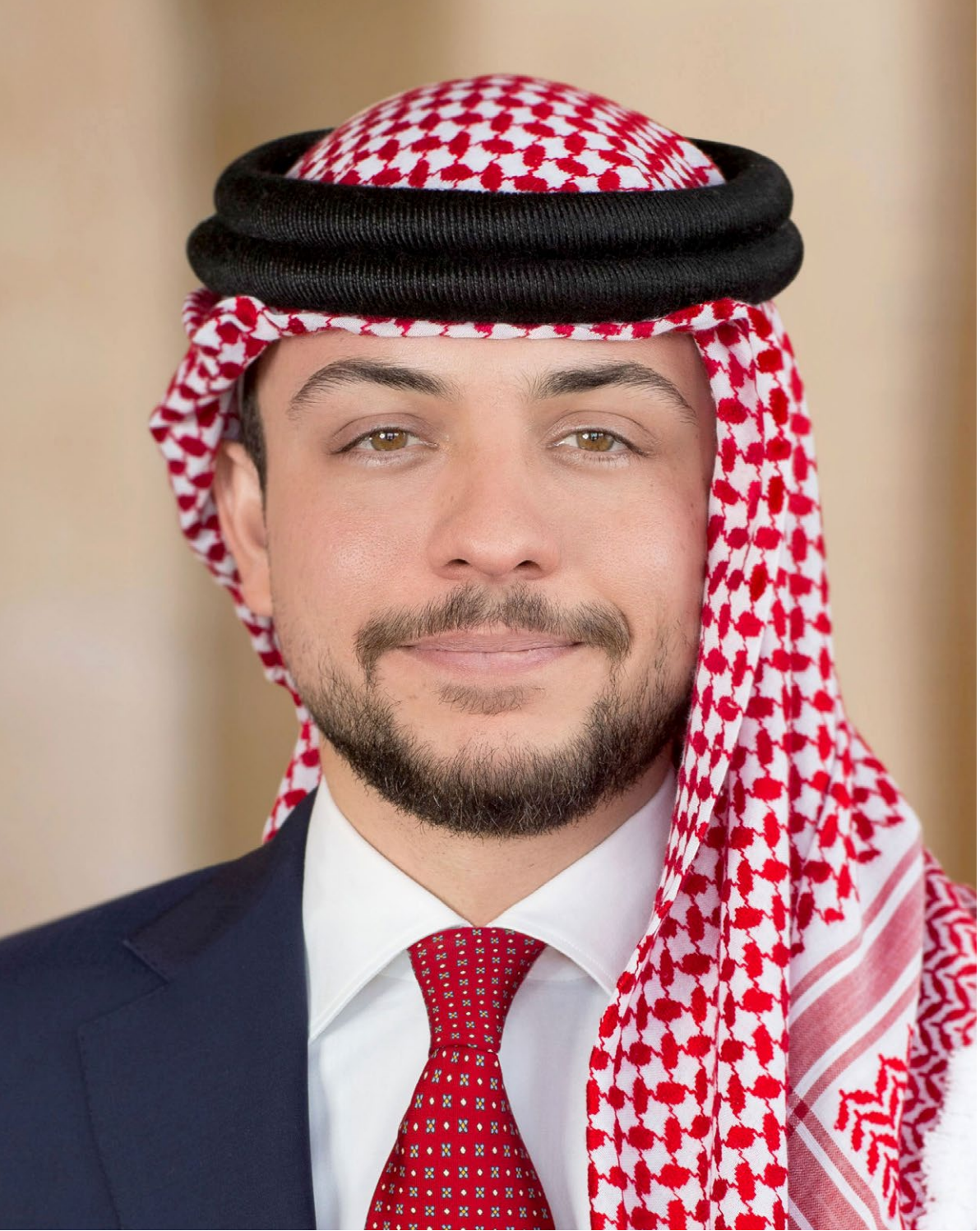
صاحب السمو الملكي ولي العهد الأمير الحسين بن عبدالله الثاني المعظم